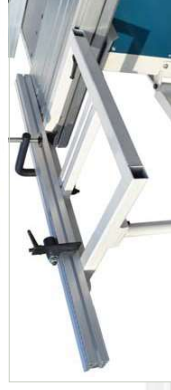
Mesa deslizante Sliding table