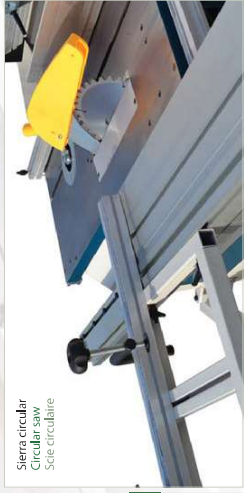
Sierra circular Circular saw Scie circulaire