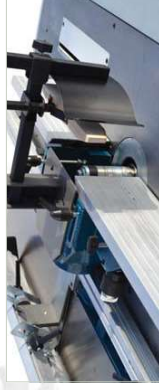
Tupi Spindle moulder