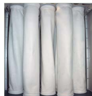
Mangas filtrantes con limpieza automática temporizada Filters with automatic timed cleaning Sacs filtrants avec nettoyage automatique temporisée