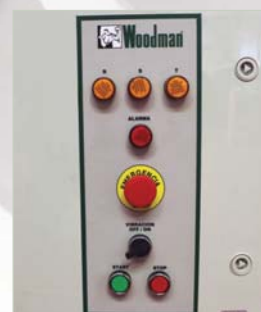
Panel de mandos Control panel Panneau de commande